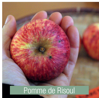
Pomme de Risoul