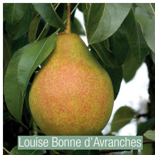
Louise Bonne d'Avranches