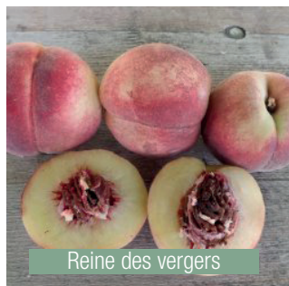
Reine des vergers