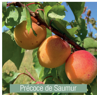
Précoce de Saumur